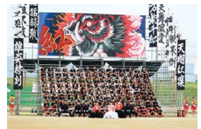
大運動会 (令和元年度)