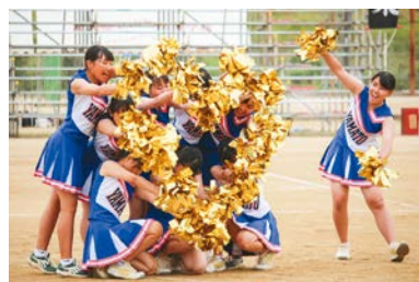
大運動会 (令和元年度)