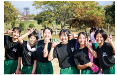
スポーツフェスタ

今でもできること、今だからできることがある！私たちの新しい学校行事の形を見つけた！