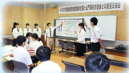
みやま市環境衛生課と生徒会の意見交換会