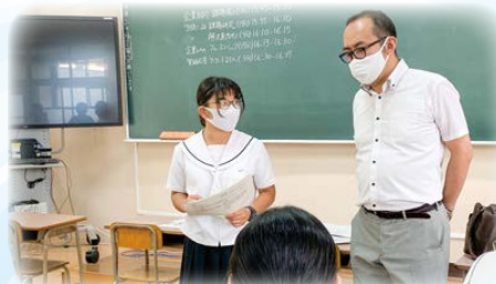
地域企業と連携する探究活動