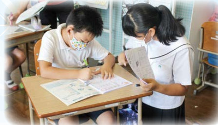
みやま市内小学校での学習ボランティア