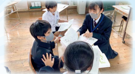
開小学校で話し方講座のボランティア