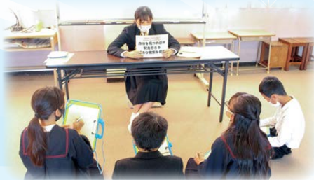
南小学校の進路学習に参加