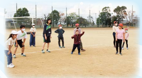
瀬高小学校の皆さん!ようこそ山門高校へ