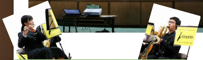
吹奏楽部 ~見事な演奏と生徒会のダンスで 発表会のラストを飾りました~