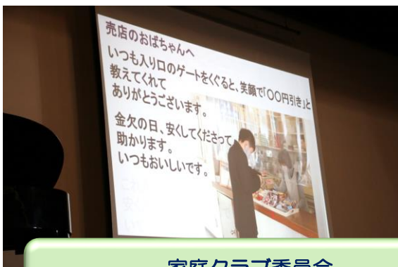
家庭クラブ委員会 ~なかなか言えない日頃の感謝を言葉に~