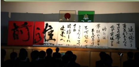
書道部 ~圧巻の書道パフォーマンス~

例年であれば、文化部や各クラスが趣向を凝らした催し物を考案し、ステージ発表や展示発表で学校を盛り上げる柏友祭。今年度は新型コロナウイルスの影響で規模を縮小して「文化部発表会」という形に変更となりました。しかし、文化部の生徒の熱心な準備と、初めて体育館に3つの学年がそろった勢いが上手くマッチし、最高の文化部発表会になりました。文化部の皆さん準備お疲れ様でした！