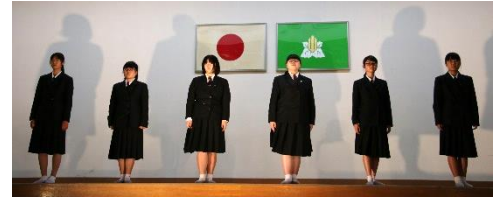
合唱部・1年音楽選択者 ~心地よいハーモニーでした~