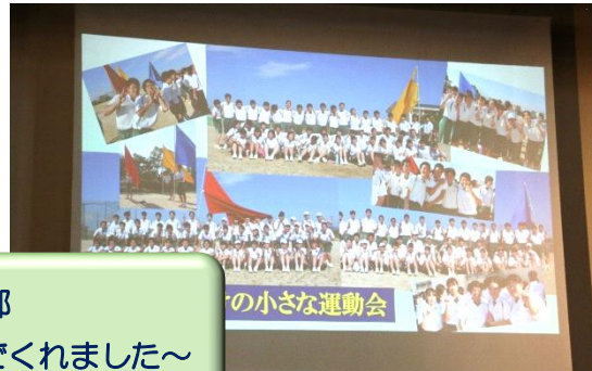
弁論放送部 ~山門ニュースを読んでもらいました~